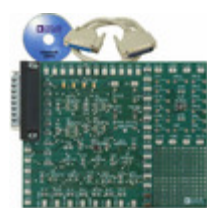
AD5248EVAL ADI (Analog Devices, Inc.) BOARD EVAL FOR AD5248