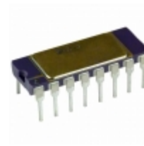
AD524AD Analog Devices Inc. IC OPAMP INSTR 1MHZ 16CDIP