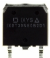
IXST30N60B2D1 IXYS IGBT 600V 48A 250W TO268