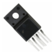
FSDM07652REWDTU Fairchild/ON Semiconductor IC SWIT PWM GREEN CM HV TO220F