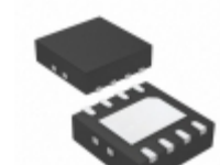
LTC4308CDD#PBF ADI (Analog Devices, Inc.) IC ACCELERATOR I2C HOTSWAP 8DFN