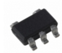
MIC5203-2.6YM5-TR Microchip Technology IC REG LDO 2.6V 80MA SOT23-5