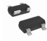
MIC5203-2.6YM4-TR Microchip Technology IC REG LDO 2.6V 80MA SOT143