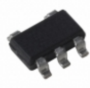
MIC5203-2.6YM5-TR Microchip Technology IC REG LDO 2.6V 80MA SOT23-5