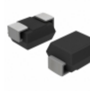
NP0900SCMCT3G ON Semiconductor THYRISTOR 75V 400A SMB