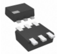
NP0A54700A Panasonic Electronic Components TRANS 2PNP 7V 0.01A SSSMINI6