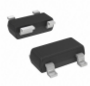
TC1270ANSVCTR Microchip Technology IC RESET MONITOR 2.93V SOT143-4