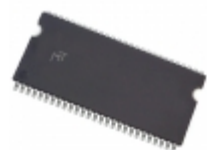
MT48LC32M4A2P-7E:G Micron Technology Inc. IC SDRAM 128MBIT 143MHZ 54TSOP