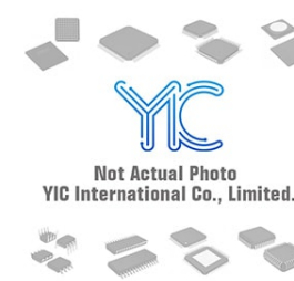
MT48LC32M16A2TG-75IT MT MT TSOP56