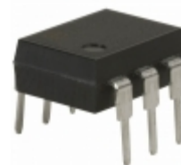
AQV227N Panasonic RELAY OPTO AC/DC 200V 70MA 6-DIP