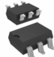
AQV225NAZ Panasonic RELAY OPTO AC/DC 80V 150MA 6-SMD