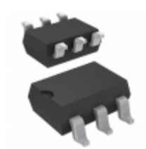
AQV225NA Panasonic RELAY OPTO AC/DC 80V 150MA 6-SMD