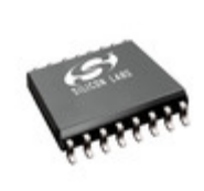
SI8621BT-ISR Energy Micro (Silicon Labs) DGTL ISO 5KV 2CH GEN PURP 16SOIC