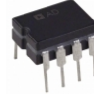
AD844SQ/883B ADI (Analog Devices, Inc.) IC OPAMP CF 60MHZ 80MA 8CERDIP