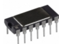
AD534SD/883B Analog Devices Inc. IC MULTIPLIER/DIVIDER 14CDIP