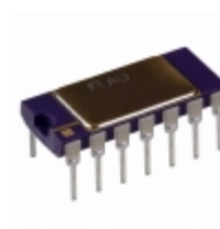
AD534SD Analog Devices Inc. IC PREC MULTIPLIER 14-CDIP