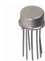
AD534LHZ Analog Devices Inc. IC MULTIPLIER TRIMMED TO-100-10