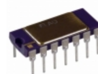
AD534KDZ Analog Devices Inc. IC PREC MULTIPLIER 14-CDIP