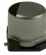
ECE-V0GA101SR Panasonic Electronic Components CAP ALUM 100UF 20% 4V SMD