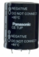
ECE-T2WP681FA Panasonic Electronic Components CAP ALUM 680UF 20% 450V SNAP