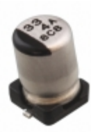
ECE-V0GA330R Panasonic Electronic Components CAP ALUM 33UF 20% 4V SMD