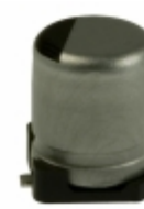
ECE-V0GA221SP Panasonic Electronic Components CAP ALUM 220UF 20% 4V SMD