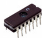
TC4468MJD Microchip Technology IC MOSFET DVR QUAD AND 14CDIP