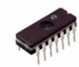
TC4468EJD Microchip Technology IC MOSFET DVR QUAD AND 14CDIP