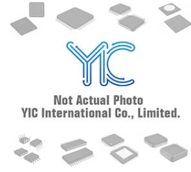
AT93C46-10PI18 ATMEL ATMEL DIP-8