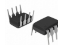
AT93C46-10PC-1.8 Microchip Technology IC EEPROM 1KBIT 2MHZ 8DIP