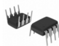
AT93C46-10PI-2.7 Microchip Technology IC EEPROM 1KBIT 2MHZ 8DIP