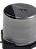
EEV-TG1A471UP Panasonic Electronic Components CAP ALUM 470UF 20% 10V SMD