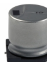
EEV-TG1C222UM Panasonic Electronic Components CAP ALUM 2200UF 20% 16V SMD