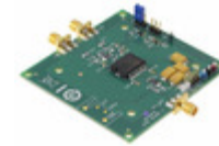
ADA4870ARR-EBZ ADI (Analog Devices, Inc.) EVAL BOARD FOR ADA4870ARR