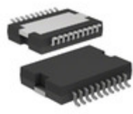
ADA4870ARRZ Analog Devices Inc. IC OPAMP 1CH HS 1A 20PSOP3