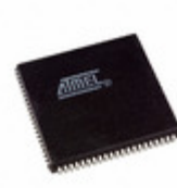
AT40K10AL-1AJC Microchip Technology IC FPGA 10K GATES 84PLCC