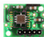
ADXL213EB ADI (Analog Devices, Inc.) BOARD EVALUATION FOR ADXL213