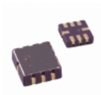
ADXL213AE-REEL Analog Devices Inc. ACCELEROMETER 1.2G PWM 8CLCC