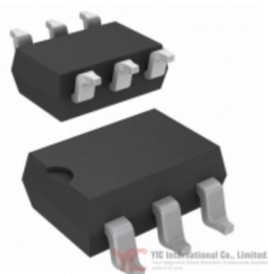
Image may be representation. See specs for product details.