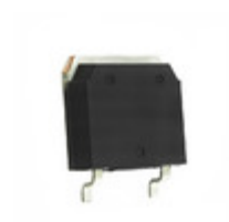
IXST45N120B IXYS IGBT 1200V 75A 300W TO268