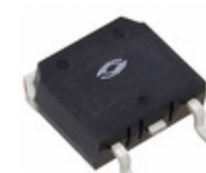
APT30M70SVRG Microsemi Corporation MOSFET N-CH 300V 48A D3PAK