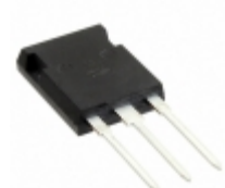
APT30S20BCTG Microsemi Corporation DIODE ARRAY SCHOTTKY 200V TO247