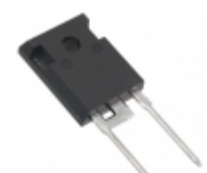
APT30S20BG Microsemi Corporation DIODE SCHOTTKY 200V 45A TO247