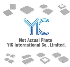
CY62157CV18LL-70BAI CYPRESS CY62157CV18LL-70BAI CYPRESS