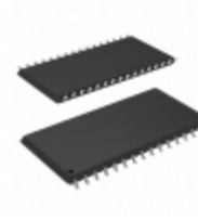
CY62148VNLL-70ZSXI Cypress Semiconductor Corp IC SRAM 4MBIT 70NS 32TSOP