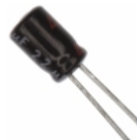
ECE-A0GKK220 Panasonic Electronic Components CAP ALUM 22UF 20% 4V RADIAL