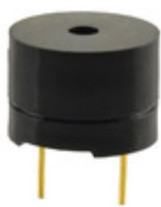
CMT-1285C-035 CUI Inc. AUDIO MAGNETIC XDCR 3-5V TH