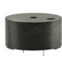
CMT-2412C-120 CUI Inc. AUDIO MAGNETIC XDCR 10-14V TH