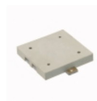
CMT-1603-SMT-TR CUI Inc. AUDIO PIEZO TRANSDUCER 25V SMD