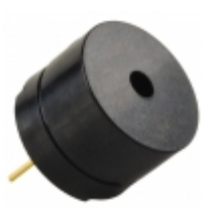
CMT-1285C-015 CUI Inc. AUDIO MAGNETIC XDCR 1-2V TH