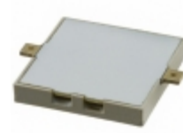
CMT-1604-SMT-TR CUI Inc. AUDIO PIEZO TRANSDUCER 25V SMD