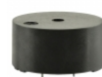
CMT-2412C-050 CUI Inc. AUDIO MAGNETIC XDCR 4-6V TH