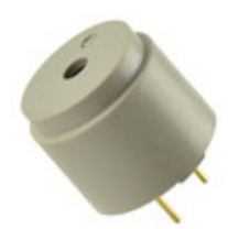
CMT-1614C-120 CUI Inc. AUDIO MAGNETIC XDCR 9-13V TH