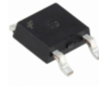
IRLR110ATF Fairchild/ON Semiconductor MOSFET N-CH 100V 4.7A DPAK