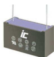
MPX274K305G Illinois Capacitor CAP FILM 0.27UF 10% 305VAC RAD