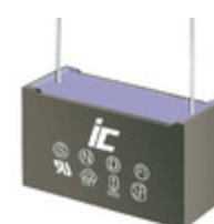
MPX334K305E Illinois Capacitor CAP FILM 0.33UF 10% 305VAC RAD