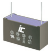
MPX333K305D Illinois Capacitor CAP FILM 0.033UF 10% 305VAC RAD