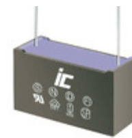
MPX274K305E Illinois Capacitor CAP FILM 0.27UF 10% 305VAC RAD