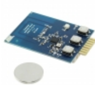
ATA5771-DK1 Microchip Technology BOARD XMITTER FOR ATA5771 868MHZ