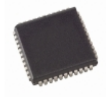
PSD312B-70J STMicroelectronics IC MCU PROG 512KB 5V 70NS 44PLCC