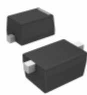
CMOZ27L TR Central Semiconductor Corp DIODE ZENER 27V 250MW SOD523