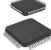
MCL908LJ12CPBE NXP USA Inc. IC MCU 8BIT 12KB FLASH 64LQFP