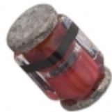
MCL4448-TR Electro-Films (EFI) / Vishay DIODE GP 75V 150MA MICROMELF