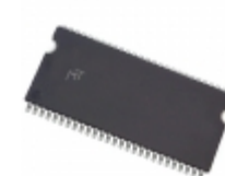
MT48LC8M16LFTG-75M:G Micron Technology Inc. IC SDRAM 128MBIT 133MHZ 54TSOP