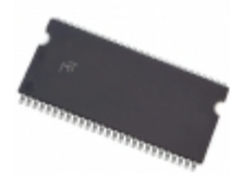
MT48LC8M16LFTG-75:G Micron Technology Inc. IC SDRAM 128MBIT 133MHZ 54TSOP