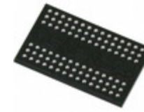
MT48LC8M32B2B5-7 Micron Technology Inc. IC SDRAM 256MBIT 143MHZ 90VFBGA