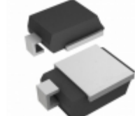
SM6S17A-E3/2D Electro-Films (EFI) / Vishay TVS DIODE 17V 27.6V DO218AB