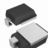
SM6S17AHE3/2D Vishay Semiconductor Diodes Division TVS DIODE 17VWM 27.6VC DO218AB