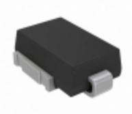
SM6S16ATHE3/I Electro-Films (EFI) / Vishay TVS DIODE 16V 26V DO218AC