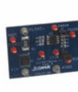
ISL6115EVAL1Z Intersil EVAL BOARD ISL6115