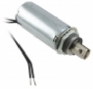
F0484A Pontiac Coil, Inc. SOLENOID PULL INTERMITTENT 24V