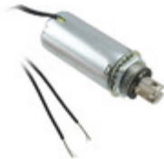
F0481A Pontiac Coil, Inc. SOLENOID PULL CONTINUOUS 12V