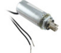
F0482A Pontiac Coil, Inc. SOLENOID PULL INTERMITTENT 12V