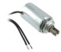
F0491A Pontiac Coil, Inc. SOLENOID PULL CONTINUOUS 12V