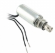
F0472A Pontiac Coil, Inc. SOLENOID PULL INTERMITTENT 12V