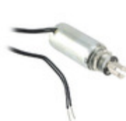
F0471A Pontiac Coil, Inc. SOLENOID PULL CONTINUOUS 12V