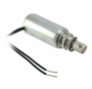
F0474A Pontiac Coil, Inc. SOLENOID PULL INTERMITTENT 24V