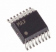
MAX4613EEE+T Maxim Integrated IC SWITCH QUAD SPST 16QSOP