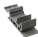
DRA-2 Bussmann (Eaton) ADAPTER DIN-RAIL 0-30A GRAY