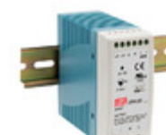
DRA-60-12 MEAN WELL AC/DC CONVERTER 12V 60W