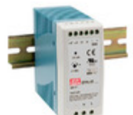
DRA-40-24 MEAN WELL AC/DC CONVERTER 24V 41W