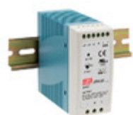
DRA-60-24 MEAN WELL AC/DC CONVERTER 24V 60W