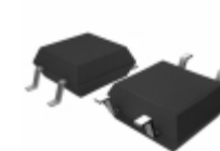
BU4220F-TR Rohm Semiconductor IC DETECTOR VOLT 2.0V ODRN 4SOP