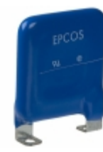
LS40K440QP EPCOS (TDK) VARISTOR 715V 40KA CHASSIS