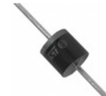
BZW50-100 STMicroelectronics TVS DIODE 100VWM 228VC R6