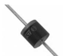
BZW50-10 STMicroelectronics TVS DIODE 10VWM 23.4VC R6