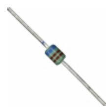
MAZ40620MF Panasonic Electronic Components DIODE ZENER 6.2V 370MW DO34