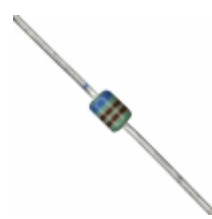
MAZ40620MF Panasonic Electronic Components DIODE ZENER 6.2V 370MW DO34