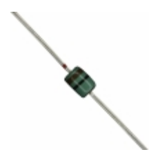
MAZ410000F Panasonic Electronic Components DIODE ZENER 10V 370MW DO34