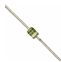
MAZ409100F Panasonic Electronic Components DIODE ZENER 9.1V 370MW DO34