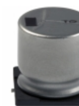
EEV-TG1E102UM Panasonic Electronic Components CAP ALUM 1000UF 20% 25V SMD