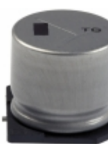
EEV-TG1E222M Panasonic Electronic Components CAP ALUM 2200UF 20% 25V SMD