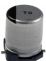
EEV-TG1E221UP Panasonic Electronic Components CAP ALUM 220UF 20% 25V SMD