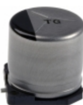
EEV-TG1E331UP Panasonic Electronic Components CAP ALUM 330UF 20% 25V SMD