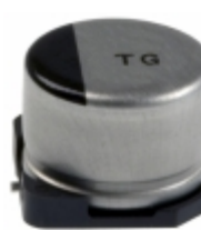
EEV-TG1E470P Panasonic Electronic Components CAP ALUM 47UF 20% 25V SMD