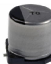
EEV-TG1V101P Panasonic Electronic Components CAP ALUM 100UF 20% 35V SMD