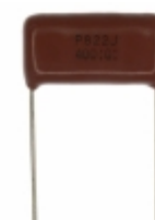
ECQ-P4822JU Panasonic Electronic Components CAP FILM 8200PF 5% 400VDC RADIAL