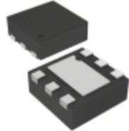
RT9198-27GQW Richtek USA Inc. IC REG LDO 2.7V 0.3A 6WDFN