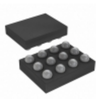
FPF2595UCX Fairchild/ON Semiconductor IC LOAD SWITCH CURR LIMIT 12WLCS