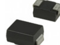
SMBJ60CA Fairchild/ON Semiconductor TVS DIODE 60VWM 96.8VC SMB