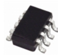
AD8502ARJZ-REEL7 Analog Devices Inc. IC OP AMP GP RRIO 7KHZ SOT23-8