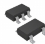
ADP1712AUJZ-1.5-R7 Analog Devices Inc. IC REG LDO 1.5V 0.3A TSOT23-5