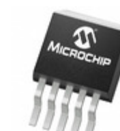
MCP1825-5002E/ET Microchip Technology IC REG LDO 5V 0.5A DPAK